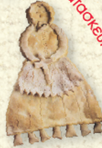
Κατασκευή με ζυμώρι

Μας δείχνει τα φρεσκοψημένα της λαζαράκια και λαζαρίνες, καθώς και τα μυρωδάτα λαμπροκούφουρα!